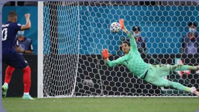
CONCOURS DE PENALTIE