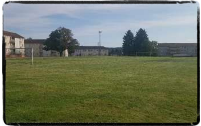
STADE DU BREUIL

Vous jouerez sur des infrastructures de qualité.