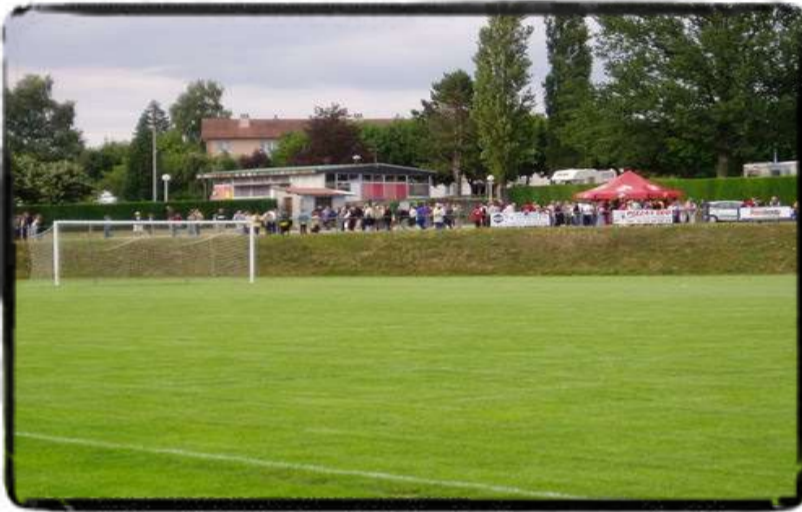
STADE RAYMOND POULIDOR